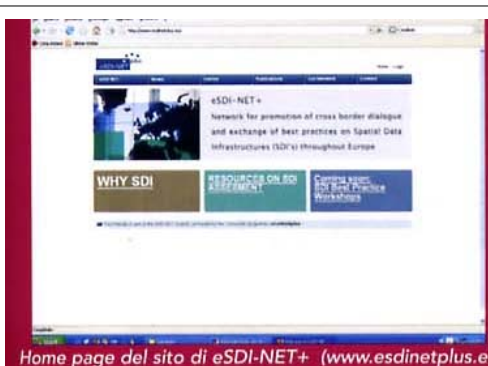
Home page del sito di eSDI-NET+ ( www.esdinetplus.eu )

WP2: Identificazione e analisi delle "Best Practices" (PM 3-18) Obiettivi - All'interno di questo pacchetto di lavoro verranno raccolte le informazioni riguardanti le iniziative regionali,